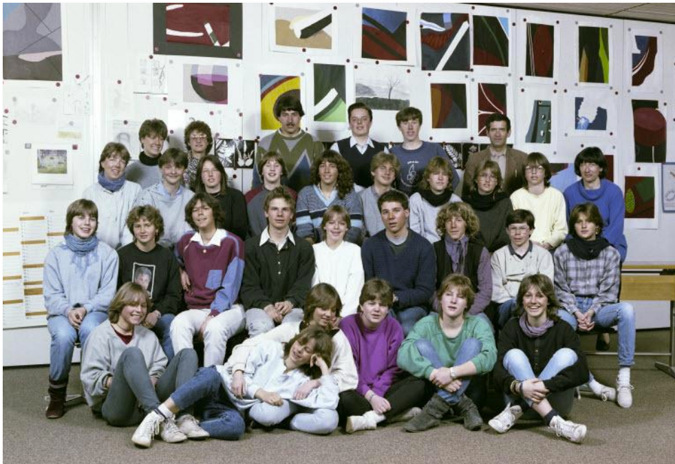
Auch wir waren vielfältig, verschieden und einzigartig (1. Sek, 1981)

Individuelle Lernwege ermöglichen und differenziert begleiten