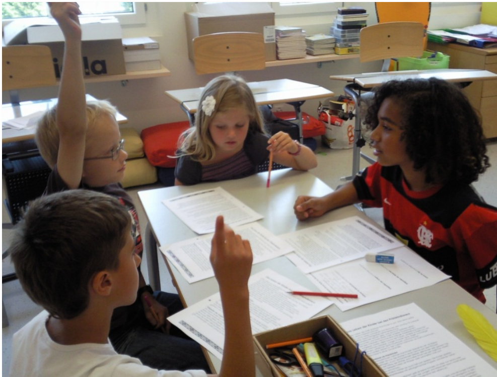
„Lernen durch Lehren“

Verschmelzung von fachlichen und überfachlichen Kompetenzen ist gefragt