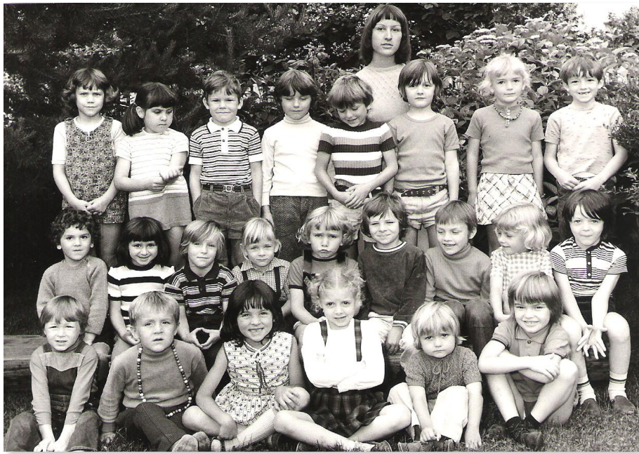
Auch wir waren vielfältig, verschieden und einzigartig (1. Klasse, 1973)

Individuelle Lernwege ermöglichen und differenziert begleiten