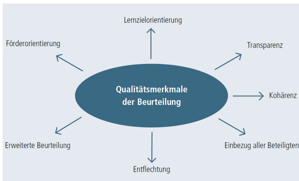
aus: fördern und fordern, Kanton Solothurn, S. 11

Nicht alle im neuen Lehrplan aufgeführten Kompetenzen und Kompetenzstufen müssen beurteilt werden. Wie bisher gehört es zur Professionalität der Lehrpersonen, zu überlegen, wann und mit welchen Mitteln sie Leistungen der Schülerinnen und Schüler einschätzen und beurteilen.